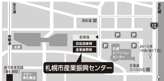
※駐車場(有料)の利用台数が限られていますので、できるだけ地下鉄等をご利用ください。

申込方法 下欄の受講申込書に必要事項をご記入の上、FAXでお申込みください。また、ホームページ上でオンラインによる申込み受け付けております。