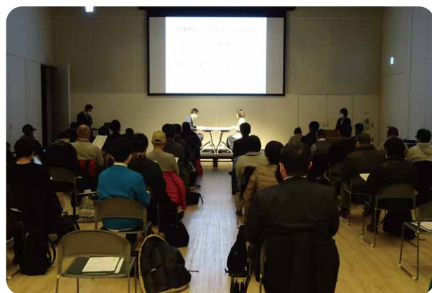
※昨年度のセミナーの様子

起業を考えている方が金融機関に初めて相談する様子を「寸劇」で見せながら、起業に役立つ情報や知っておきたいポイントを解説。 「起業の相談ってこんな風なんだ」と感じながら、かる〜い気持ちでご観覧ください。また、起業に関する情報の宝庫!「図書・情報館」の活用法もわかりやすくお伝えします。